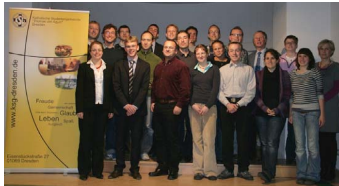
Gründungsveranstaltung Oktober 2010

Unser Verein wurde von 22 Mitgliedern gegründet.